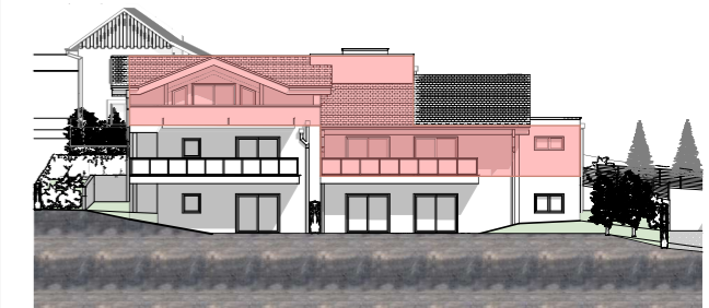
Plan façade SUD